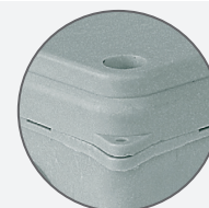
Pokrywa zatraskowa i uchwyt do zamocowania plomb. Clamping cover and a holder to fasten the leaden seal.