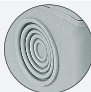
Dławica zintegrowana Integrated cable gland

The new version of box has got a special holder. He allows to mounting of boxes to bunch of cables or other spatial elements.