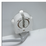
Gniazdo T8 G13